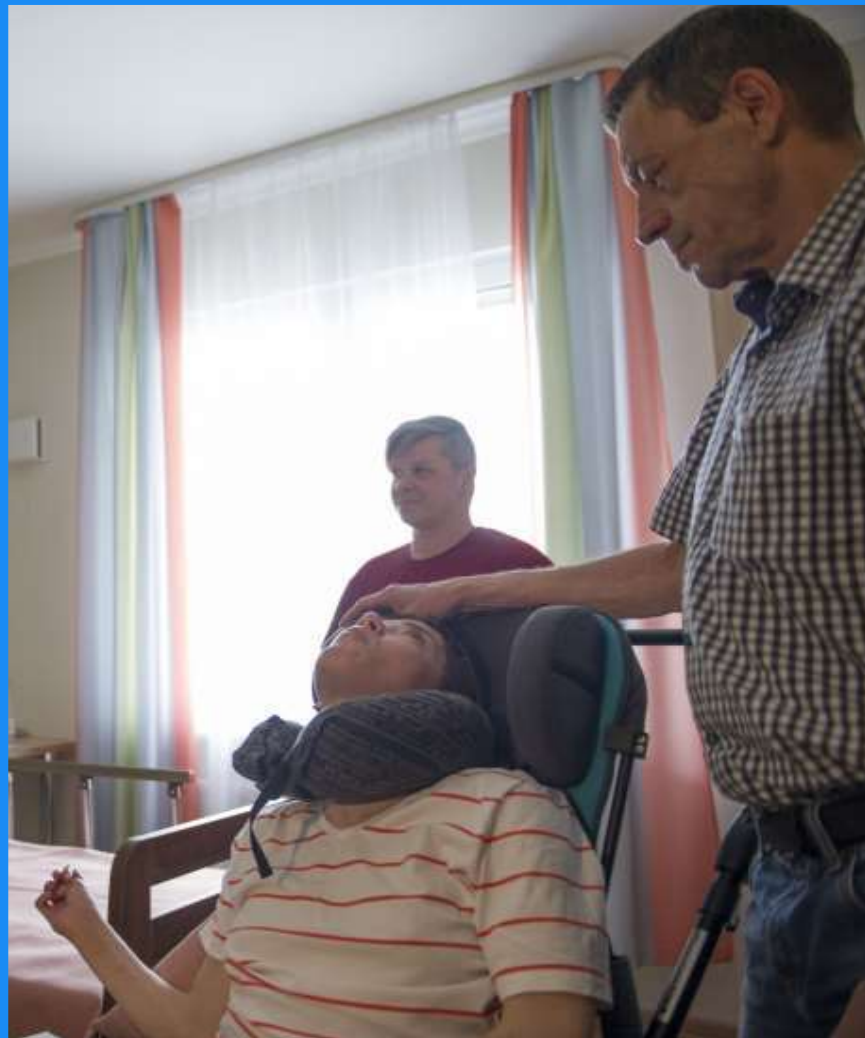
Проживание дома с семьей