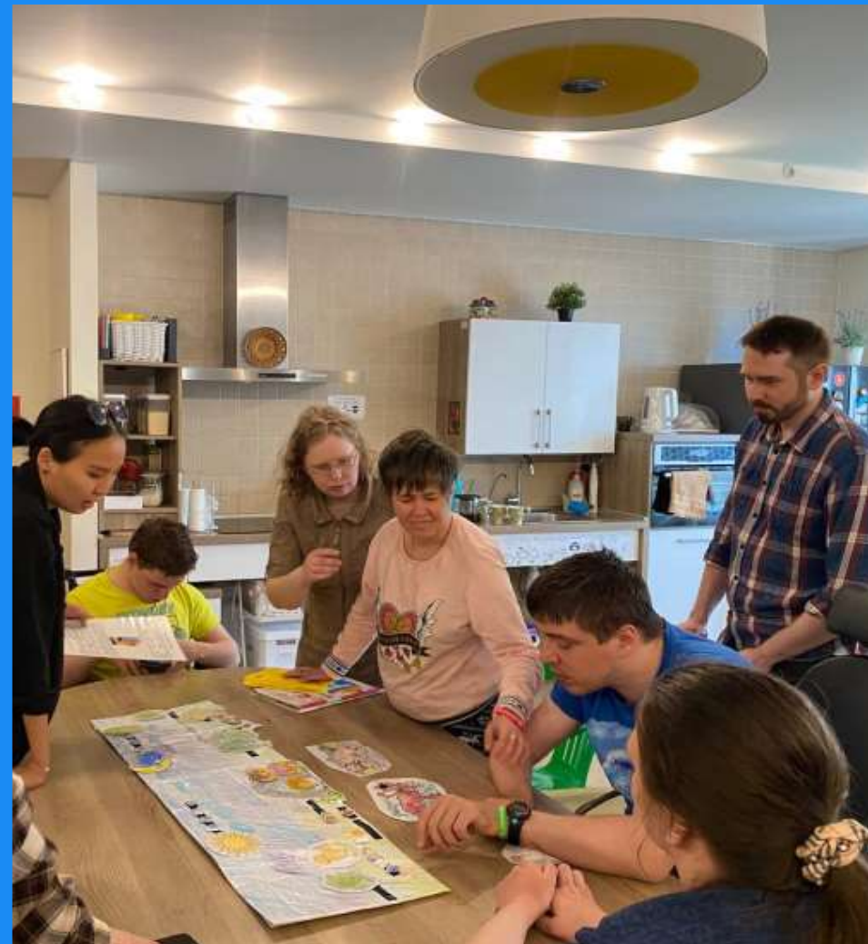
Проживание малыми группами